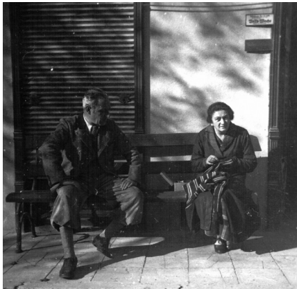
Walters Eltern vor dem Geschäft in Bischofstetten, 1938

Ich glaub nicht, dass mein Vater es geahnt hat oder dass er es gewusst hätte. Das waren ja seine besten Freunde, die sind fast jeden Sonntag bei uns gewesen, mit denen haben wir gemeinsam Ausflüge gemacht. Und dann stellt sich heraus, dass die schon die längste Zeit Parteimitglieder waren, illegale Nazis. Und gleich am nächsten Morgen sind zwei SA-Männer ins Geschäft gekommen und haben meinem Vater bedruckte Papierstreifen hingelegt. Die müsse er an den Schaufenstern aufmachen, haben sie verlangt. Und auf diesen Streifen stand in großen Lettern: „Judengeschäft!“ Als ob das nicht ohnehin ein jeder im Ort gewusst hätte! Ich weiß nicht mehr, was mein Vater dazu gesagt hat, ob ihn das verletzt hat. Er war erschrocken über das rüde Auftreten dieser Männer. Und gleichzeitig haben auch die beiden anderen Greißler plakatiert, auf ihren Auslagen stand: „Kauft nicht bei Juden!“ Und von nun an war es so, dass uns niemand mehr gekannt hat. Wir wurden zwar nicht angefeindet, aber man hat uns gemieden. Nur ein paar wenige, die sind wirklich an-