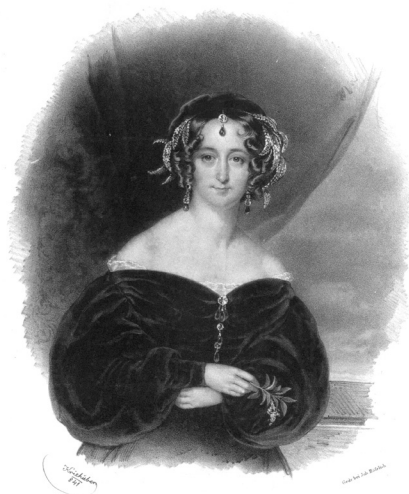
Wilhelmine von Sagan wohnte im gleichen Haus in der Wiener Schenkenstraße wie ihre eifersüchtige Konkurrentin, die russische Fürstin Bagration. Beide buhlten um Metternich und den russischen Zaren Alexander.

Abseits dieser amourösen Ablenkungsmanöver galt es aber Politik zu machen. Dabei stand für Metternich viel auf dem Spiel. Er hatte bei seinen politischen Entscheidungen zwischen dem Bedürfnis nach einer Abrechnung mit Napoleon und der Angst vor einem möglichen Aufbegehren der Untertanen abzuwägen. Auch Letzteres hatte mit Napoleon zu tun, führte er doch in den von ihm annektierten Ländern den Code Napoléon als Gesetzbuch ein, das neben bürgerlichen Rechten auch die Abschaffung der Adelsprivilegien sowie die Befreiung der Bauern garantierte. Diese Gesetze liefen aber den Absichten Metternichs zuwider, der sich vornapoleonische Zustände wünschte und damit alle Energie in den Erhalt des bestehenden Machtgefüges bzw. des europäischen Gleichgewichts steckte.