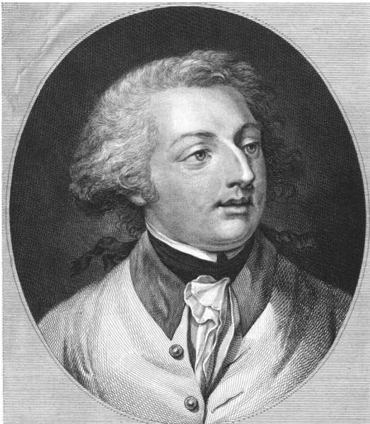
Von Charles de Ligne (1735–1814) stammt die Einschätzung, der Kongress komme nicht vom Fleck.

Scheitern auf hohem und zugleich geschmackvollem Niveau an, was den Fürsten de Ligne vielleicht auch zu einem weniger bekannten Ausspruch veranlasst haben könnte: Mit viel Geschmack und wenig Geist kann man immer noch Erfolg haben, niemals aber mit viel Geist und wenig Geschmack. 9 Fürst Charles de Ligne, der sich, einer alten Familientradition und adeligem Selbstverständnis folgend, für eine militärische Laufbahn entschied, trat 1752 noch unter Maria Theresia in den Dienst der kaiserlichen Armee, in der er an