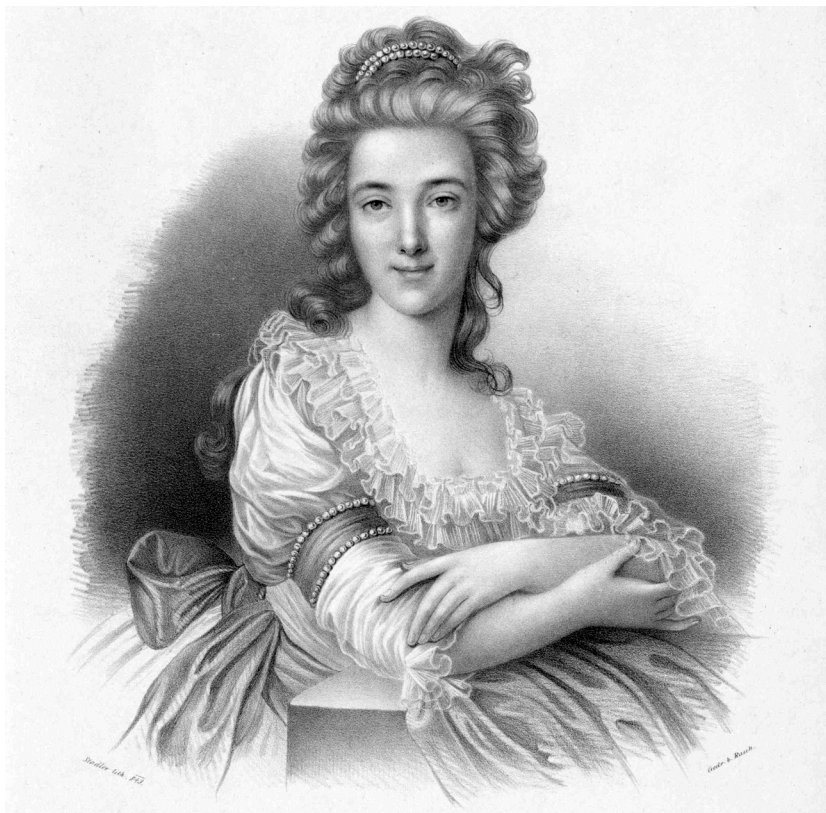
Den Schilderungen der Wiener Salonière, Lyrikerin und Schriftstellerin Caroline Pichler (1769–1843) verdanken wir entscheidende Einblicke in die Mentalität der Zeit.